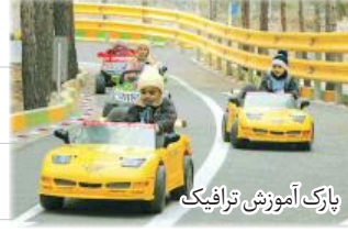
پارک آموزش ترافیک

هَلْ هُنَا مَنطَقَةُ تَعْلِيمِ الْمُرُورِ؟